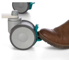
3. Lås bromsen