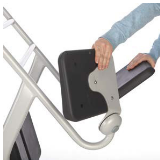
1. Fäll upp de två säteshalvorna.