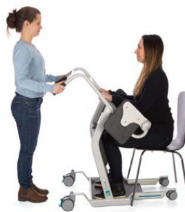
2. Kör intill vårdtagaren.